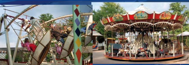
Historisches Karussell, über 100 Jahre alt, wunderschön restauriert, feinste Handarbeit aus Holz wie das Original.